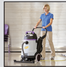
Décapage de plancher