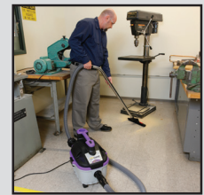
Entretien sur chantier

Tuyau éclaté, bataille de nourriture, traces de boue, inondation, décapage des planchers... voici une solution d'