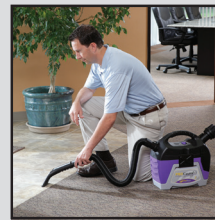
Intervention d'urgence en cas de déversement