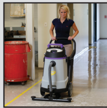
Conditions météorologiques extrêmes