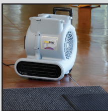
Entrée/ Tapis d'entrée